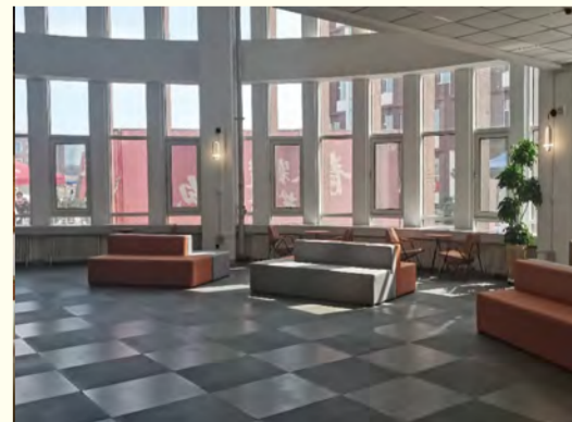
学生公寓内景一角 呼雪晶供稿