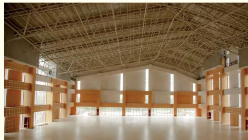
风雨操场内景