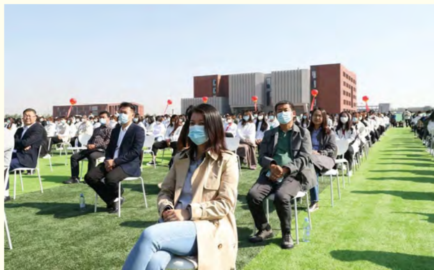
云谷校区启用仪式现场