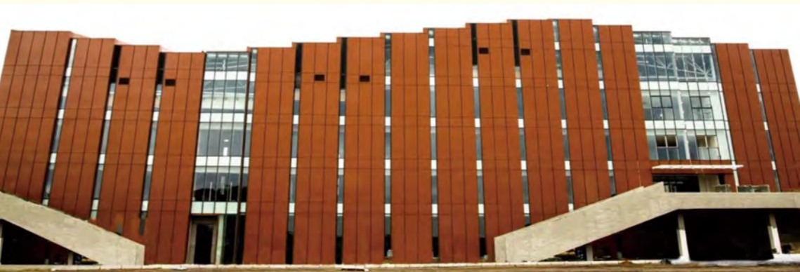
风雨操场