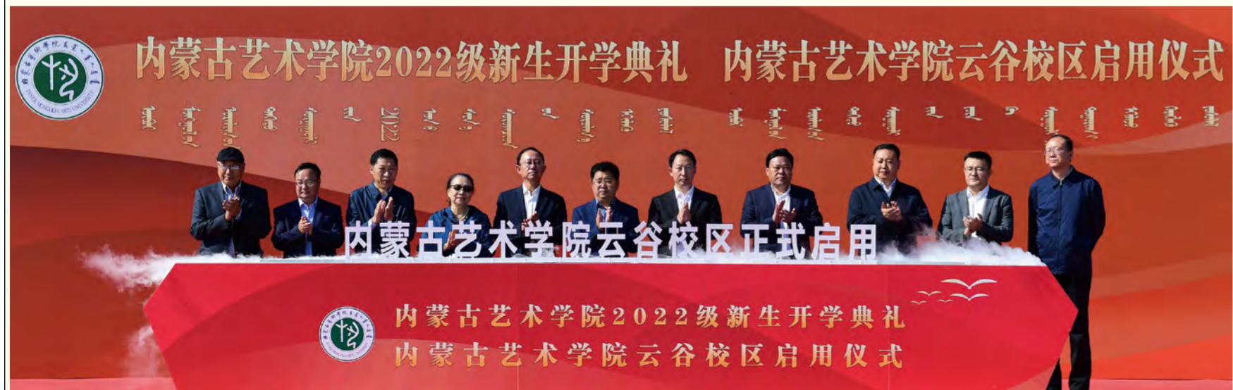
与会部分领导嘉宾共同为内蒙古艺术学院云谷校区举行启用仪式