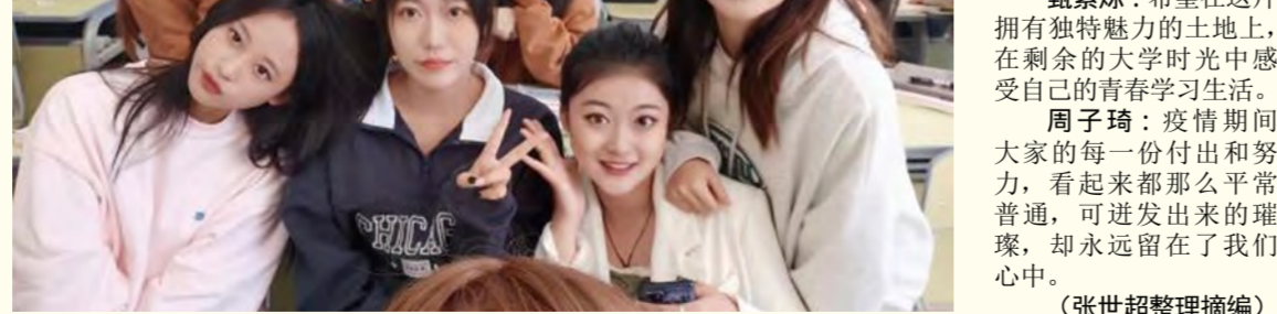
2020级播音与主持艺术专业部分学生合影