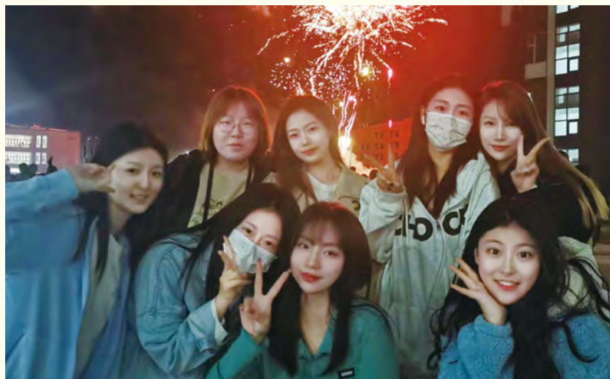
2020级播主班同学在云谷校区启用仪式之夜烟花现场合影