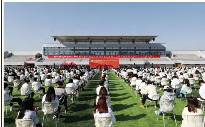
云谷校区启用仪式现场